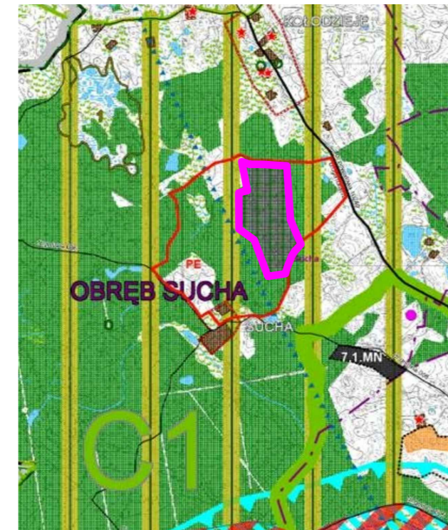
WYRYS ZE STUDIUM UWARUNKOWAŃ I KIERUNKÓW ZAGOSPODAROWANIA PRZESTRZENNEGO GMINY SULECZYNO (uchwalone Uchwałą Nr XXVI / 213 / 2010 Rady Gminy Sulęcino z dnia 14.07.2010 r. ze zmianami) - zał. nr 4, Kierunki zagospodarowania przestrzennego