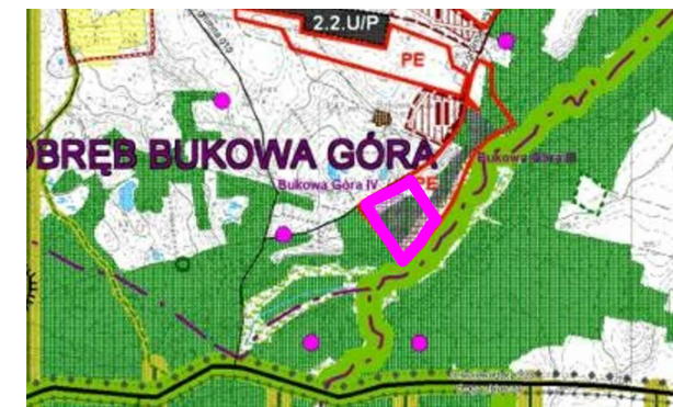
orientacyjna granica terenu opracowania MPZP